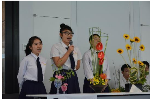
過去の「近畿大会」の様子