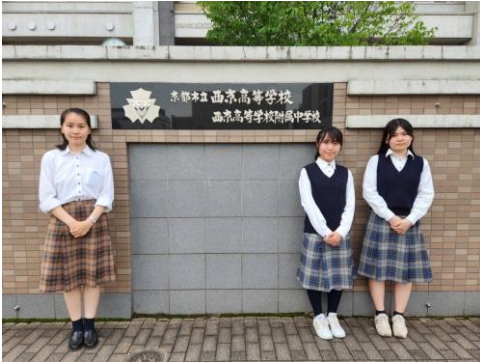
京都市立西京高等学校（京都市中京区） 花を愛する5人が集まり、自主的に活動しています。一人一人が個性豊かに花を生けています。ぜひ応援してください！