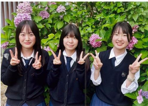
京都女子高等学校（京都市東山区） 私たちの在籍するコース、ウィステリアは「藤の花」という意味があります。藤の花のように自分は頭を垂れていても、人から見上げられる謙虚な姿勢を忘れず精進していきたいと思えます。