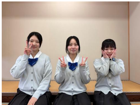
ノートルダム女学院高等学校（京都市左京区） 私達は同じコースに3年間通っています。コースの特徴のひとつとしてホスピタリティが大切にされており、私達は3年間学んできました。この経験を活かした私達の作品で、幸せな気持ちを与えられる様に頑張ります。