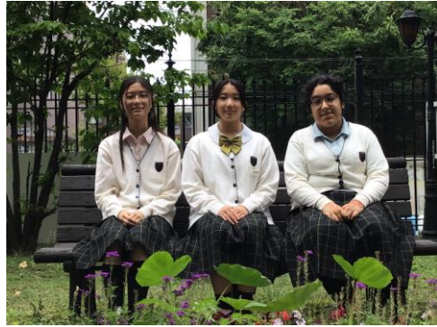
京都光華高等学校（京都市右京区） 3人の華道歴、ユニークさ、挑戦心、それぞれの特長を活かすことができるチームです。