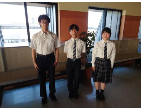
龍谷大学付属平安高等学校（京都市下京区） 生け花の技術という面では、もしかしたら負けてしまうかもしれませんが、生け花の楽しさ、楽しみ方は誰よりも知っています。